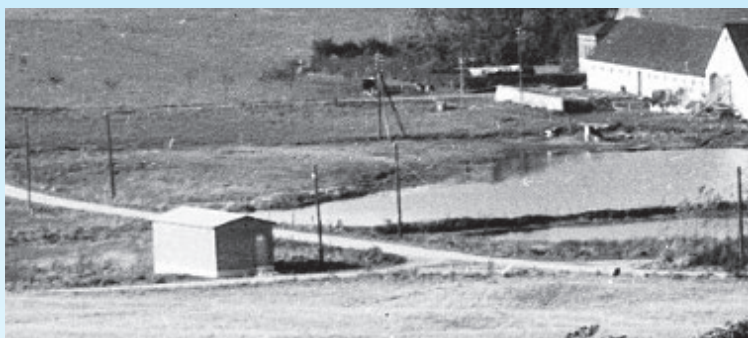
Høndrup frysehus, Smedehøjvej. 1954.