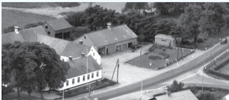
Frysehus v. »Stensgård«, Løgstørvej 69. 1958.