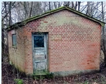
Frysehuset ved »Stensgård« i Hørby 2024.